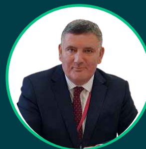
Cyng. Mark Pritchard

Rydym yn gweithio'n agos fel tîm ac wedi datblygu set o werthoedd sy'n ategu sut rydymyn gweithio a'r hyn rydym yn ei ddisgwyl gan eraill. Rydym yn uchelgeisiol, rydym yn grymuso ac yn cefnogi ein gilydd i lwyddo, mae gennym uniondeb ac rydym yn gwneud fel y dywedwn ac rydym yn parchu ac yn gwerthfawrogi pobl a'u safbwyntiau wrth i ni lunio dyfodol gwydn i Ogledd Cymru. Gobeithiwn y byddwch yn ystyried gwneud cais am y swydd hon a gobeithio y byddwch yn ymuno â ni ar y daith.